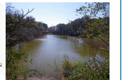
くりはまみんなの公園