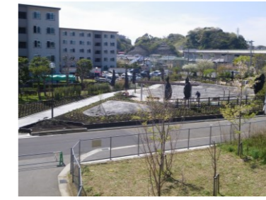
馬堀海岸4丁目第2公園