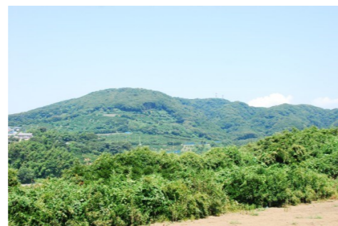
首都圏近郊緑地特別保全地区(武山地区)