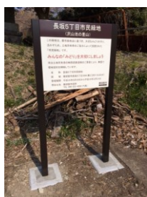
長坂5丁目市民緑地