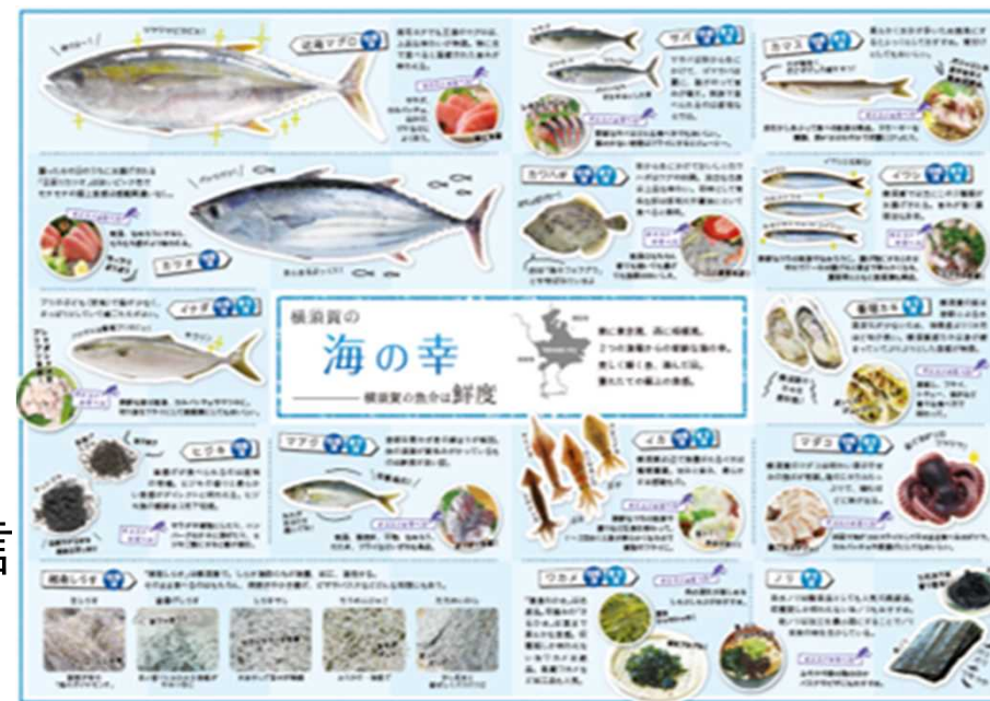
ガイドブックイメージ (よこすか海の幸・大地の恵2021年度版より)