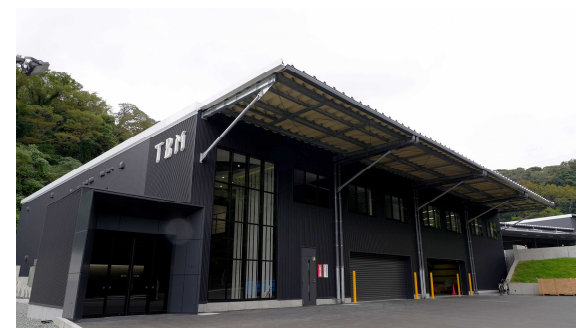
資源化・再商品化