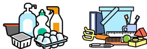
製品プラスチックの一括回収

実証事業として実施していた燃せるごみに含まれる製品プラスチックの資源化・再商品化を令和5年10月から全市域で開始することにより、燃せるごみやCO 2 排出量を削減します。