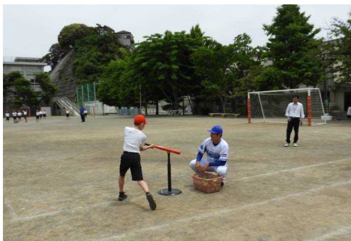
横浜DeNAベイスターズによる小学校訪問授業