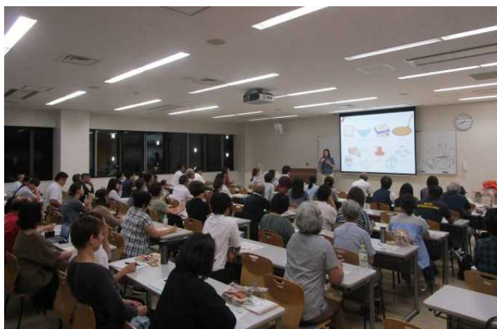
市スポーツ協会主催「スポーツ学習・講習会」

イ スポーツ推進委員と連携し、地域におけるスポーツの推進役を担ってもらうなど、地域スポーツの推進を図ります