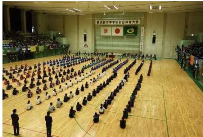
横須賀市中学校総合体育大会総合開会式