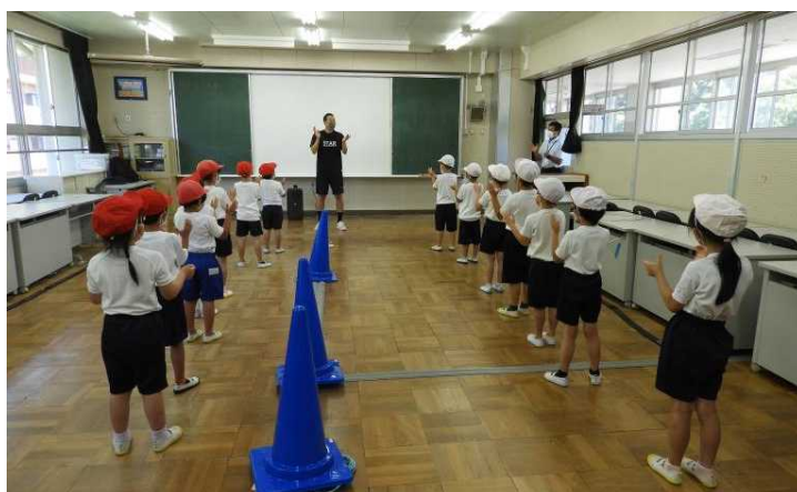
スポーツリズムトレーニング普及事業