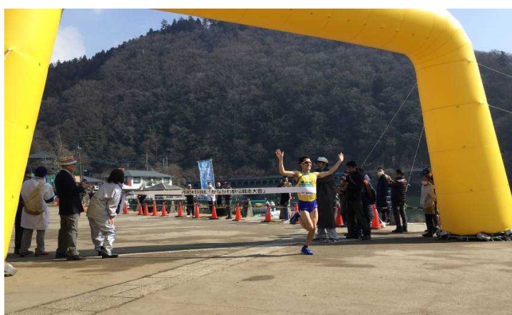
かながわ駅伝競走大会への選手派遣

イ 国際競技大会や全国大会に出場する選手や、長年スポーツ振興に功績のあった方に対し、その功績をたたえるスポーツ関連の表彰を実施します