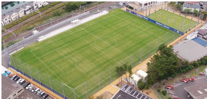
F・Marinos Sports Park ～Tricolore Base Kurihama ～

ウ 新たなスポーツ需要を掘り起こして、場や機会を提供し、スポーツをするために本市を訪れる人を増やします