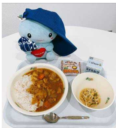
横浜 DeNA バイスターズの選手寮メニュー 「青星寮カレー」を学校給食で提供