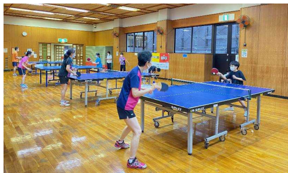
市民スポーツ教室