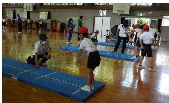
学校体育授業サポーターの派遣