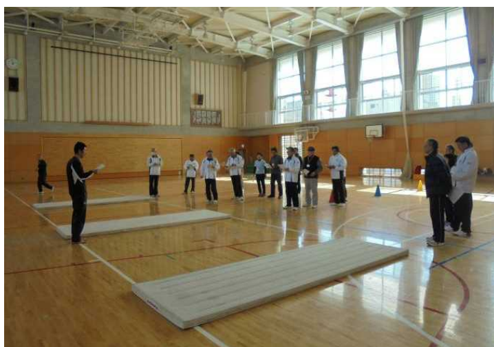
スポーツ推進委員の研修