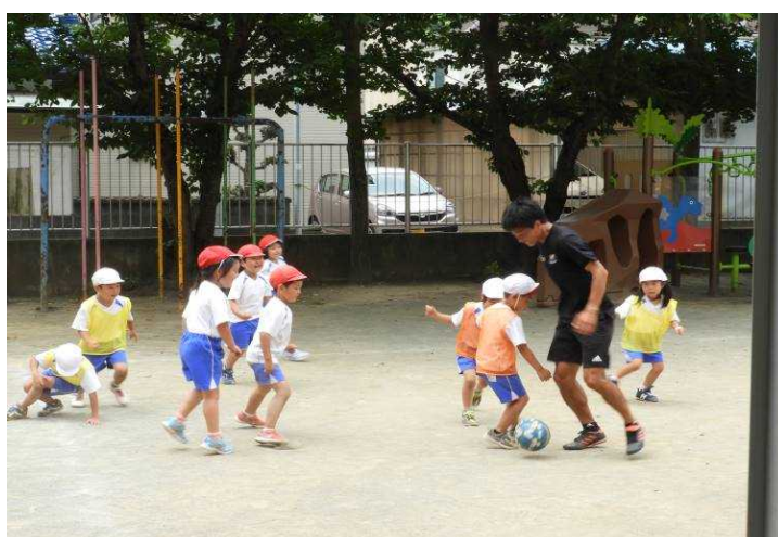
F・マリノススポーツ巡回教室