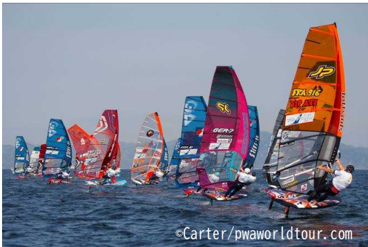
ANAウインドサーフィンワールドカップ 横須賀・三浦大会