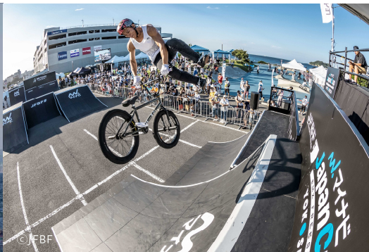
マイナビ JapanCup Yokosuka

イ 大規模スポーツ大会の開催等が、地域の活性化に結びつくような仕組みやその効果を検証する方法を検討し、実施します