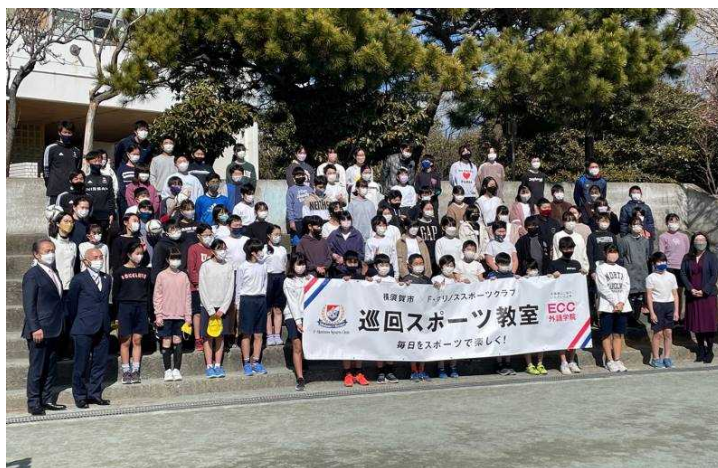
F・マリノススポーツクラブと連携した巡回スポーツ教室