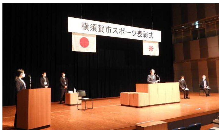
横須賀市スポーツ表彰式