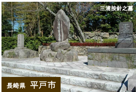
長崎県 平戸市 三浦按針之墓