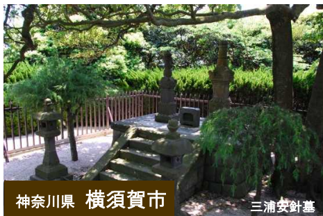
神奈川県 横須賀市 三浦安針墓