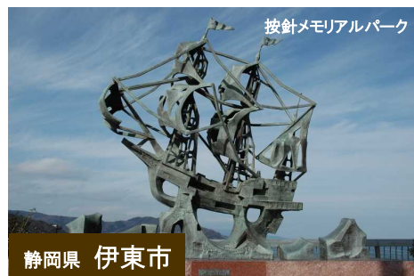
静岡県 伊東市 按針メモリアルパーク