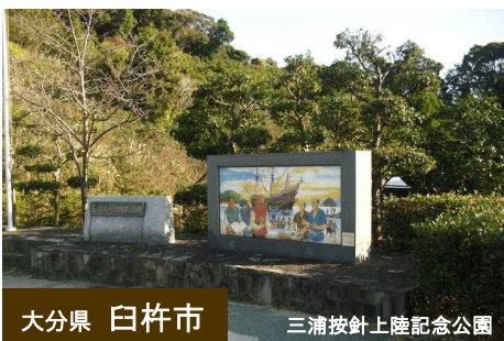
大分県 白杵市 三浦按針上陸記念公園