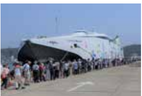
久里浜港に寄港したナッチャンWorld

平成29年度一般会計歳入歳出決算の審査では、長井海の手公園施設改修事業の完了後における入園者数の推移、大津運動公園の利用者の状況、学生居住支援事業において県立保健福祉大学だけでなく他の学校へ展開していく必要性、住宅の耐震補強工事助成事業において積極的に対象者へ向き働きかけを行う必要性などが議論されました。