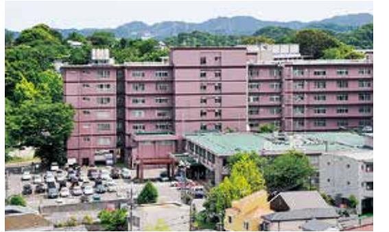
移転の方針が示されたうわまち病院