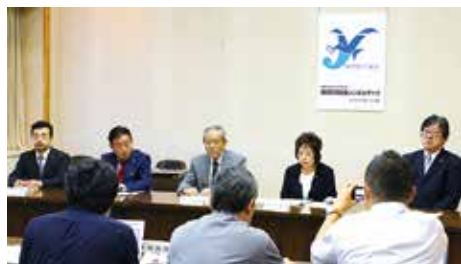
条例可決後の記者会見の様相