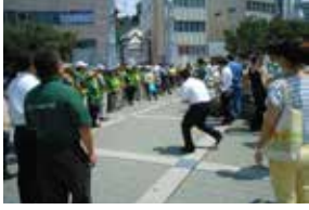
横須賀中央駅前Yデッキでのポイ捨て防止活動の様子

情については「横須賀中央駅周辺路上禁煙地区の範囲拡大について」が審査され、全会一致で趣旨了承となっています。後半の分科会における決算審査では、防災資機材倉庫の光熱水費支出額の増加理由、追浜・久里浜市民活動サポートセンターの費用対効果と今後の在り方検討の必要性、婦人防火クラブ強化に向けた対策、小動物の火葬において受益者負担の原則に立って施策を行う必要性、水道事業会計では、基本水量見直し検討の必要性、鉛配水管取替工事補助の申請件数の減少理由、下水道事業会計では、使用料金の段階的値上げにより基準外繰入を行わずに事業会計を賄う必要性についてなど多くの質疑が交わされました。