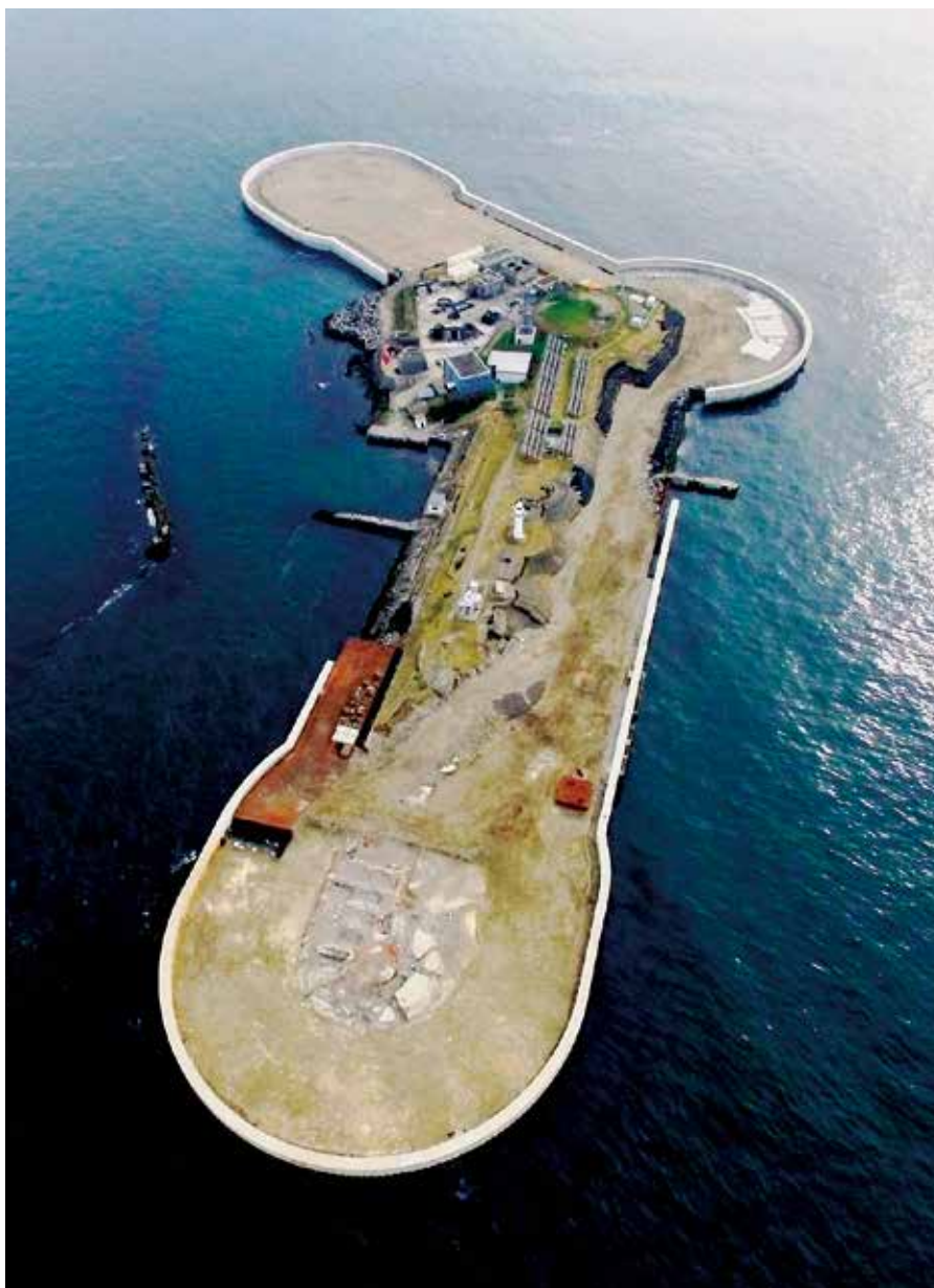
東京湾の人工島である第二海堡。明治時代に東京湾防備の要として建設された海上砲台です。8月下旬から11月中まで上陸トライアルツアーを実施し、議員も視察を行いました。