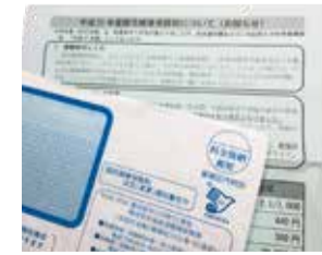
国民健康保険料について (お知らせ)イメージ

答 ほしいと思っている。生活に非常に影響がある場合には当然首長として考えていかなければならない責務だ。