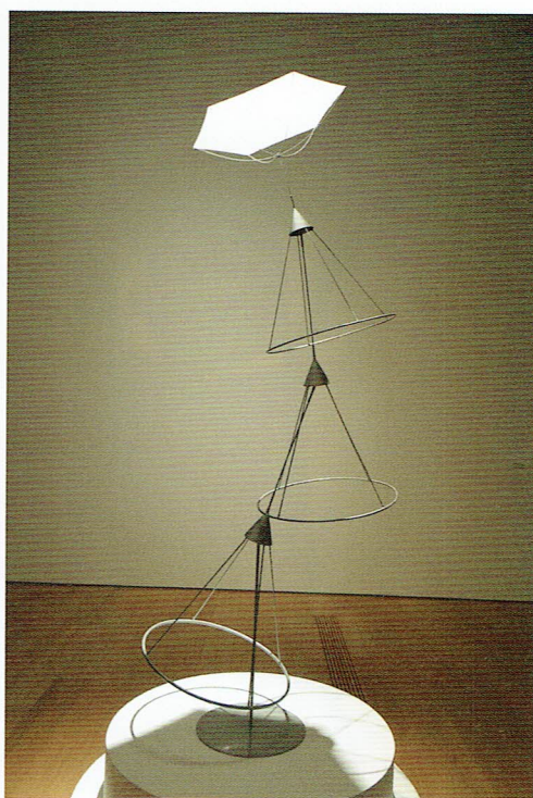
「小さな花」2013年 いずれも長崎県美術館での展示時に撮影 ©Susumu Shingu