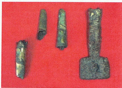
金銅製弓弭(左)・金銅裝鏝狀鐵製品(右)