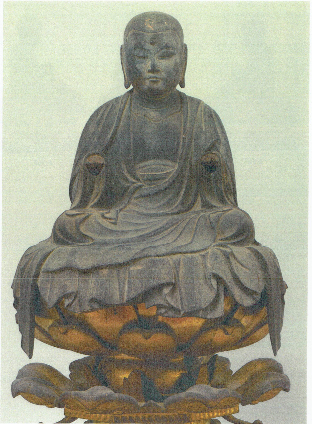
木造地藏菩薩坐像