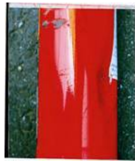
破損、変形等が 大きいもの