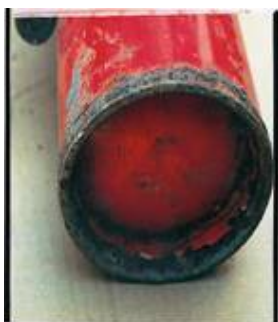
溶接部等が腐食 により剥離