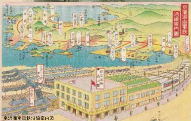
京浜湘南電鉄沿線案内図