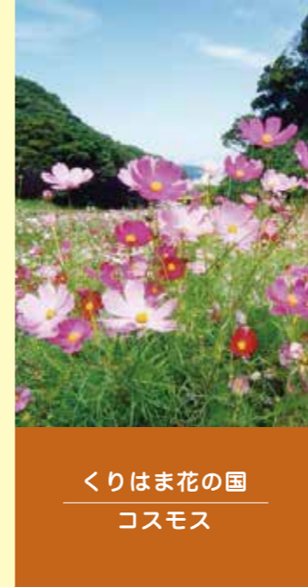
くりはま花の国 コスモス