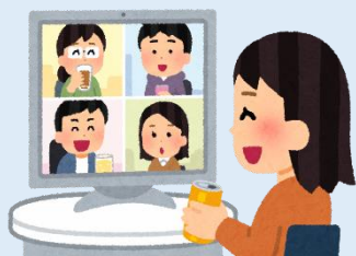
パーティーは オンラインでおこなう