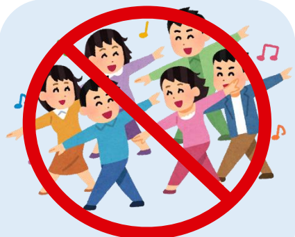
大人数であつまらない