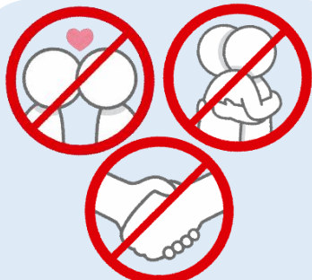
キスやハグ、握手は感染リスクの高い行為なので注意