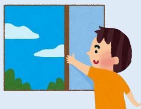
換気をする (外の空気を入れる)