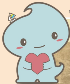
横須賀市イメージキャラクター「スカルリン」