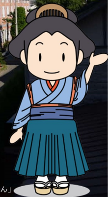
富岡市イメージキャラクター「お富ちゃん」