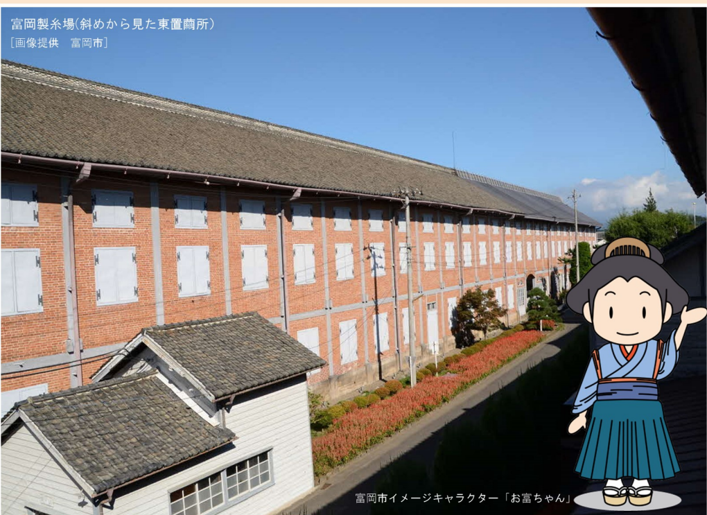
富岡製糸場(斜めから見た東置簡所)

世界文化遺産に登録されている富岡製糸場と横須賀製鉄所は、共にフランスの協力を得て、近代日本の発展に大きく貢献してきたという共通点があります。これをきっかけに、平成27年11月15日に、横須賀市と富岡市は友好都市提携を行いました。展示では、世界遺産を有する自然豊かなまち富岡市の魅力を紹介します。