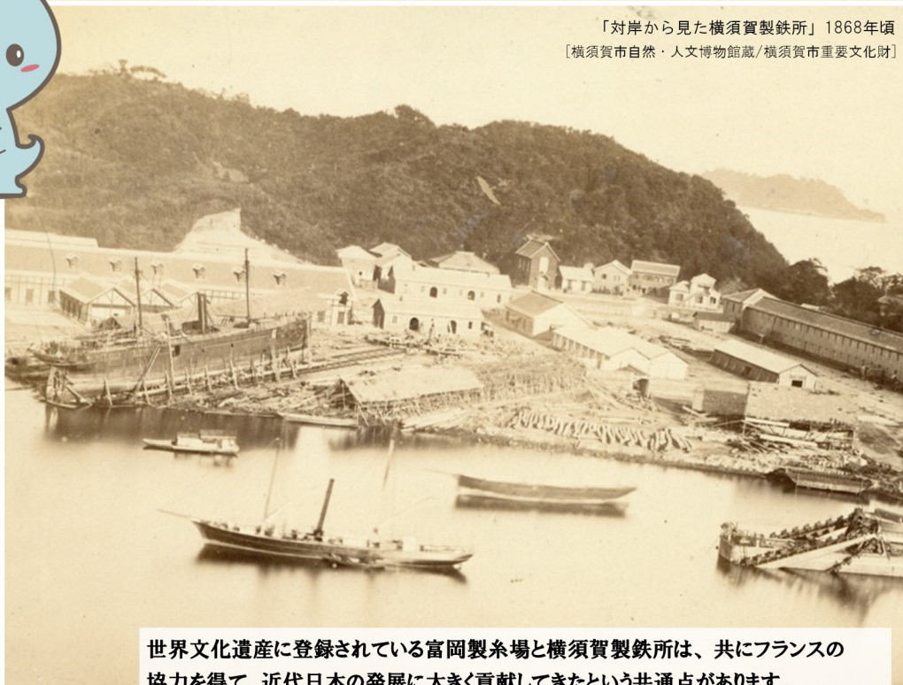
「対岸から見た横須賀製鉄所」1868年頃 [横須賀市自然・人文博物館蔵/横須賀市重要文化財]

世界文化遺産に登録されている富岡製糸場と横須賀製鉄所は、共にフランスの協力を得て、近代日本の発展に大きく貢献してきたという共通点があります。これをきっかけに、平成27年11月15日に、横須賀市と富岡市は友好都市提携を行いました。展示では、世界遺産を有する自然豊かなまち富岡市の魅力を紹介します。