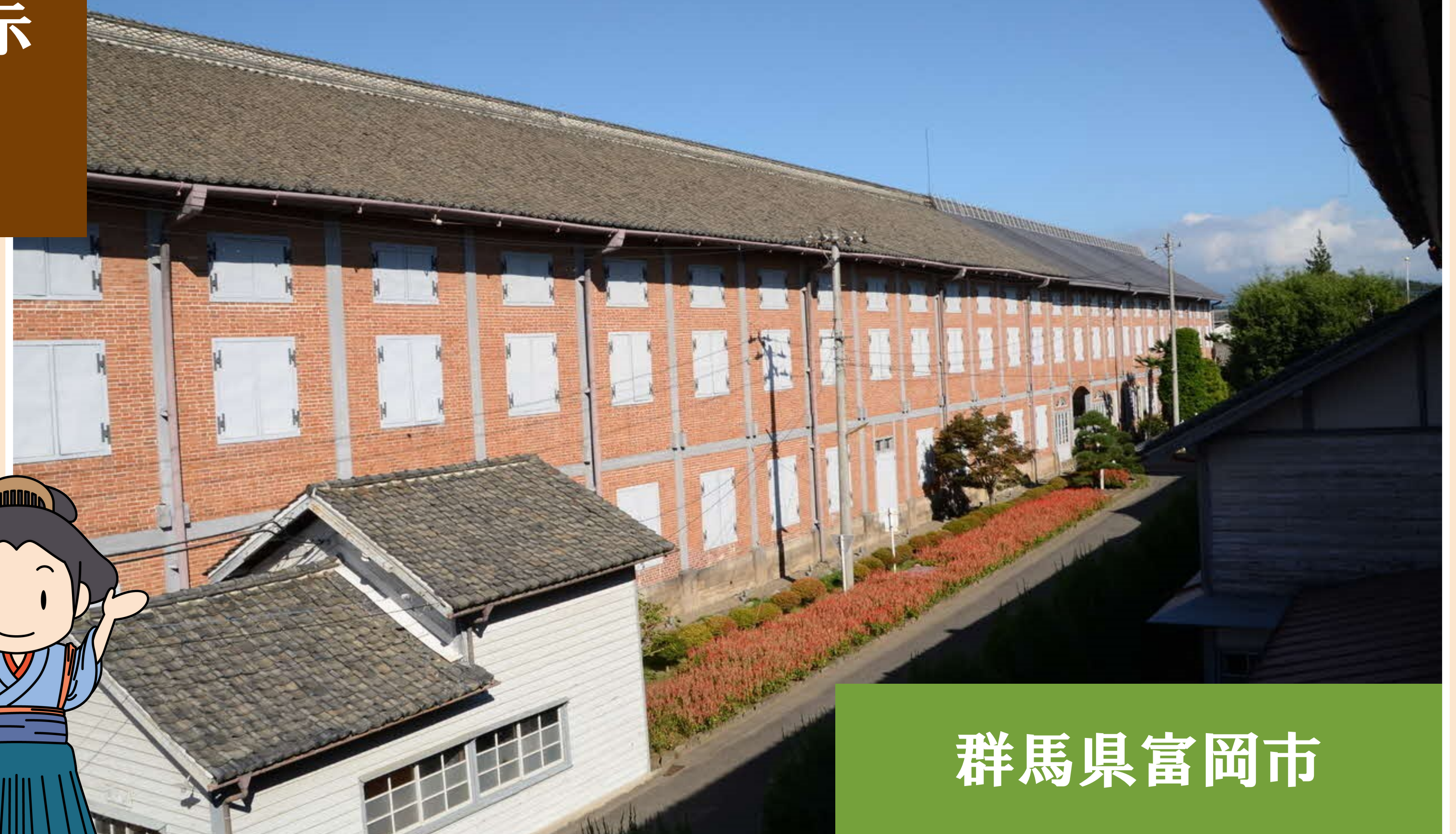
富岡製糸場(斜めから見た東置筋所)

展示では、歴史の息吹が聞こえる城下町 会津若松市、世界遺産を有する自然豊かなまち富岡市の魅力を紹介します。