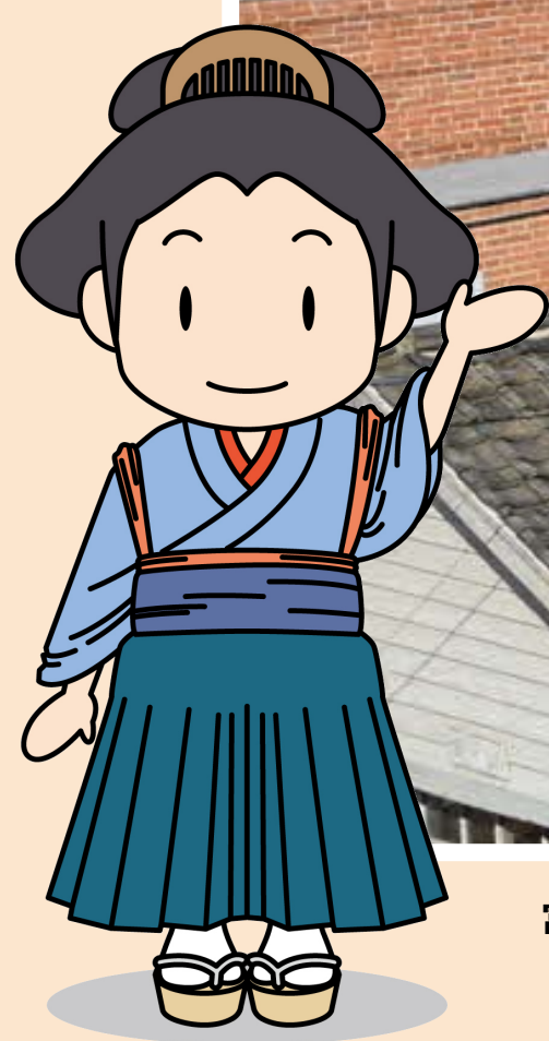
富岡市イメージキャラクター「お富ちゃん」