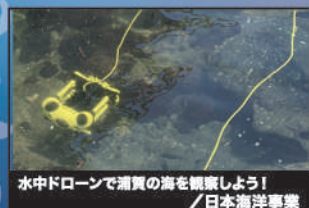
水中ドローンで清賢の海を観察しよう! / 日本海洋学業