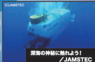
深海の神秘に触れよう!