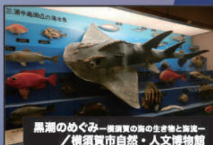
黒潮のめぐみー黒潮の海の生き物と交流ー / 横須賀市自然・人文博物館