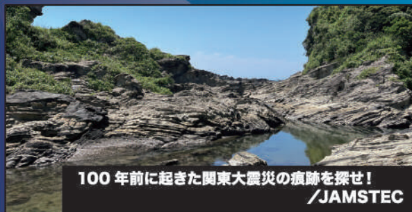
100年前に起きた関東大震災の痕跡を探せ!