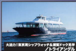
大迫力! 東京湾シップウォッチ&浦賀ドック見学 / トライアングル