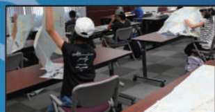
港の大研究 / 港湾空港技術研究所 ・国土技術政策総合研究所