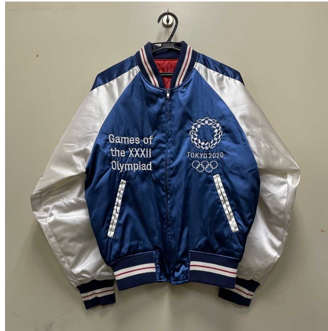
東京五輪スカジャン