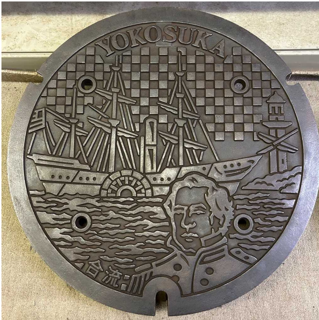
マンホール蓋（ペリー）