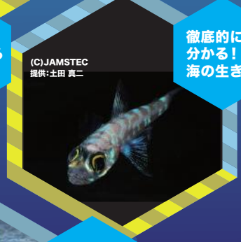
徹底的に分かる! 海の生き物