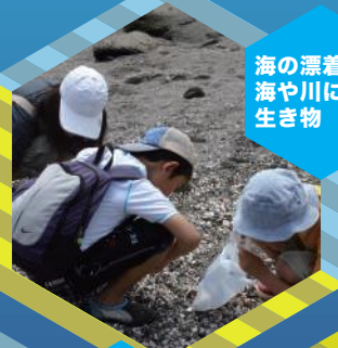
海の漂着物と海や川に住む生き物

地元の海について調べたり、海に関わる仕事の体験などを通じて、小さな“海のスペシャリスト”になれる! 毎回、各分野の専門家が先生になります。毎回の学びや気づきをレポートにまとめて、先生からフィードバックをもらうので楽しみながら様々な学びを得ることができます。