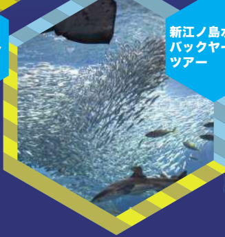
新江ノ島水族館バックヤードツアー