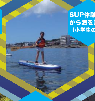
SUP体験から海を知る(小学生のみ)