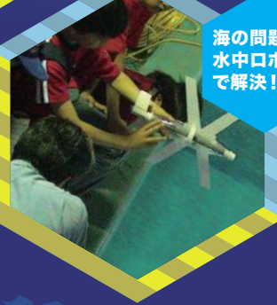
海の問題を水中ロボットで解決!?