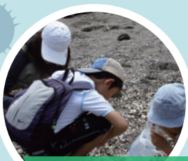
海洋プラごみと AI 開発