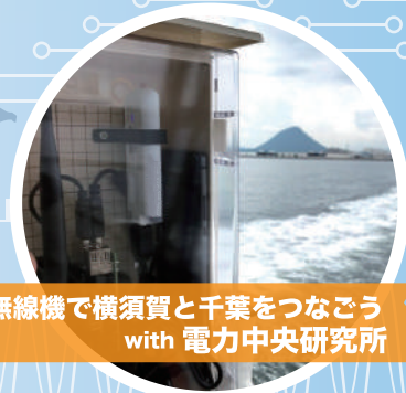
自作無線機で横須賀と千葉をつなごう with 電力中央研究所