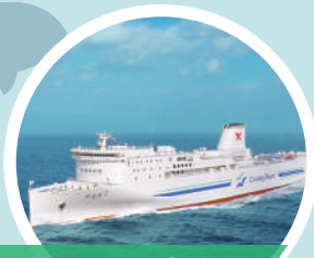
東京九州フェリー船内見学