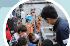
バックヤード & 海の環境 SDGs ガイドツアー