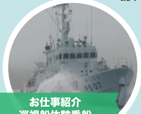
お仕事紹介 巡視船体験乗船