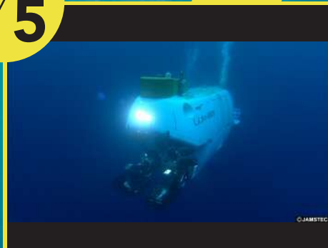
深海の研究所へ潜入せよ JAMSTEC