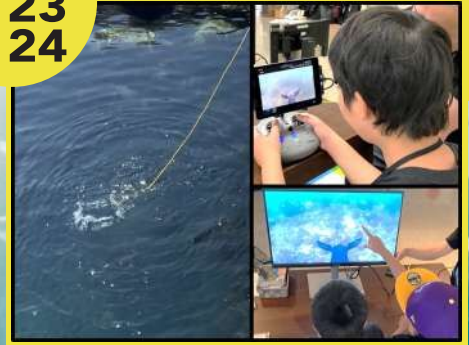
水中ドローンで海の中を探求！ 日本海洋事業