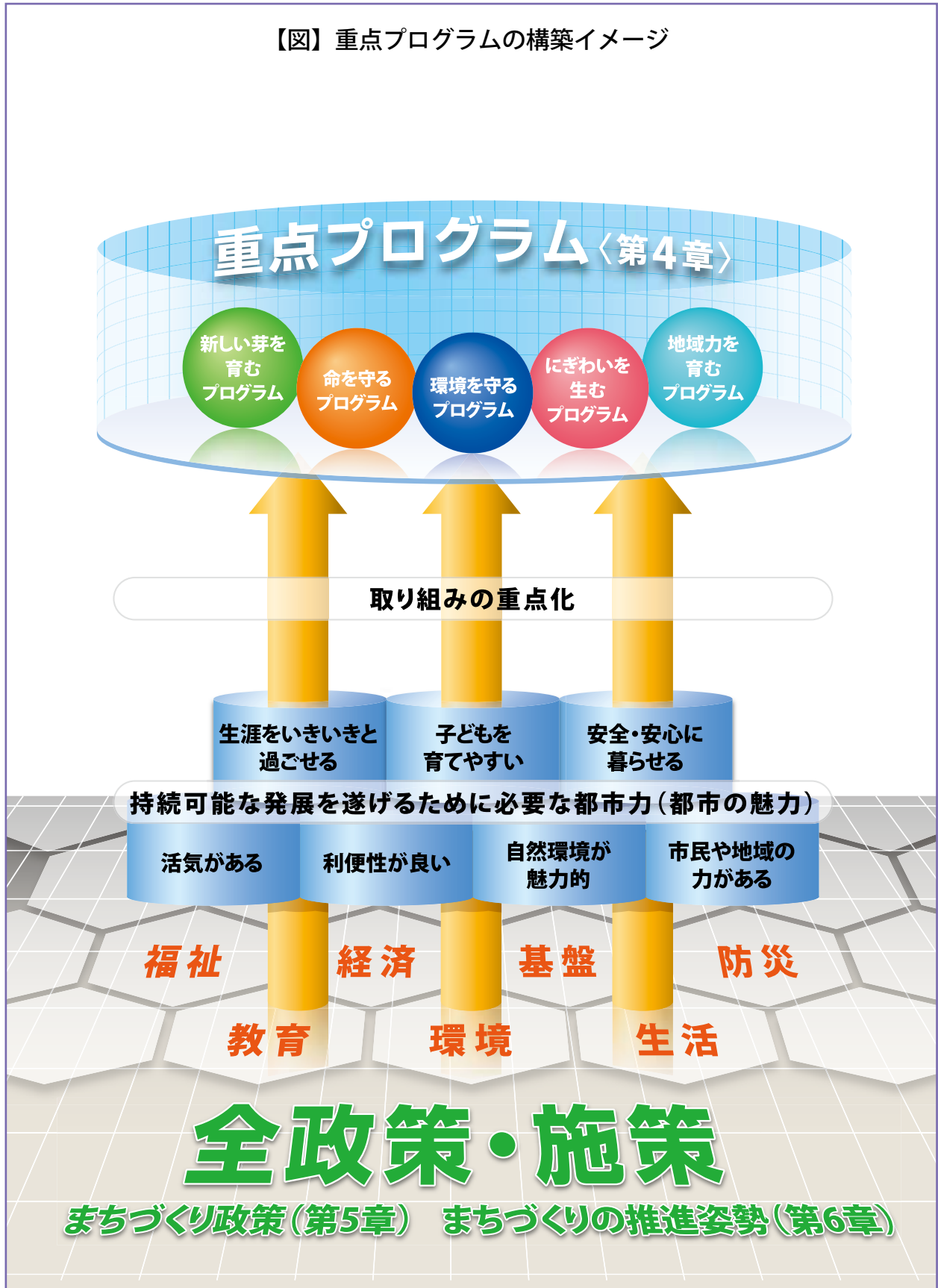
【図】重点プログラムの構築イメージ