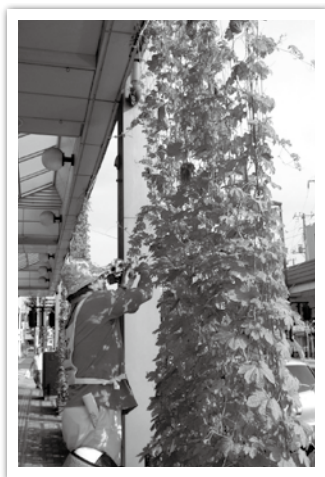
商店街での緑のカーテンの取り組み