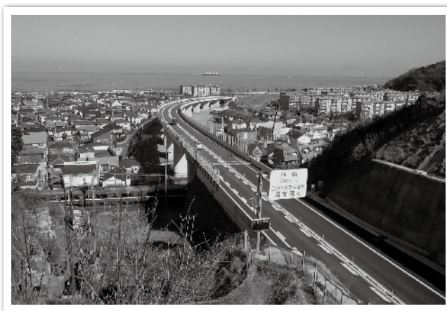
横浜横須賀道路（馬堀海岸インターチェンジ付近）