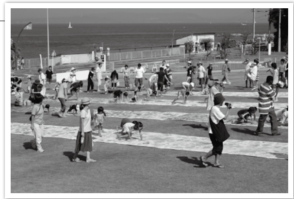
横須賀美術館の夏のボランティアイベント