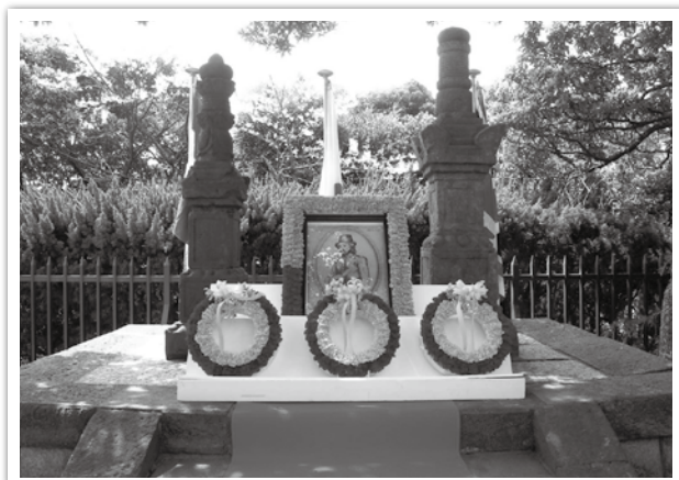
三浦按針祭観桜会（塚山公園）