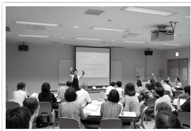
市民大学講座（生涯学習センター）