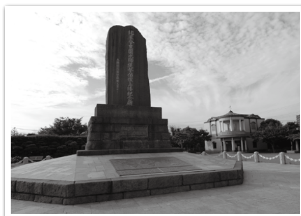
ペリー上陸記念碑（ペリー公園）