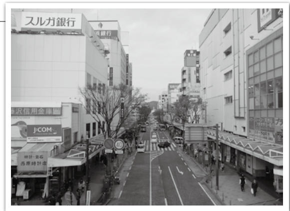
Yデッキから見た中心市街地