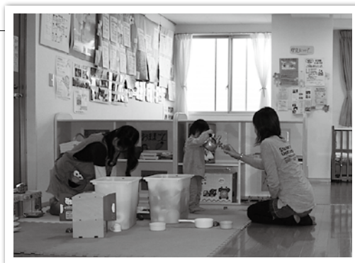
子育て支援センター（愛らんどよこすか）