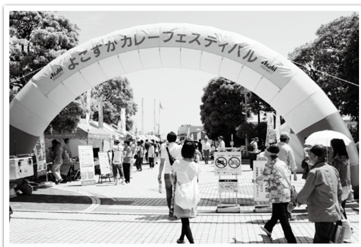
よこすかカレーフェスティバル（三笠公園）