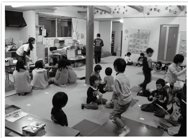
学童クラブ（根岸わんぱく・なかよしクラブ）