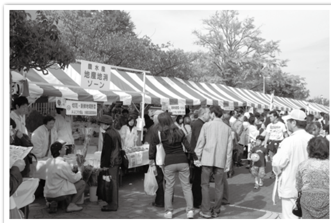
よこすか産業まつり（三笠公園）