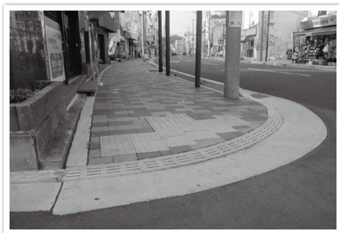
安全で快適な歩道の整備