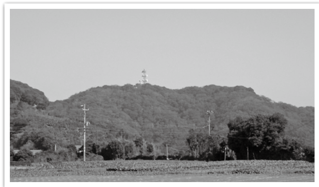
丘陵の豊かな緑（武山）