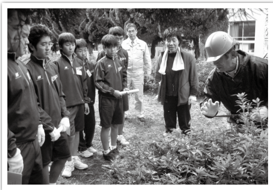
中学校のキャリア教育