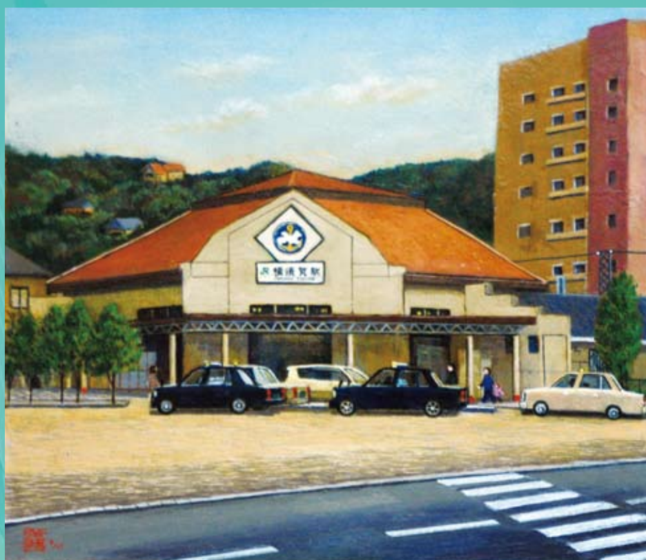
有川 義明さん「客待ち」 平成22年度 シティホールギャラリー展示作品