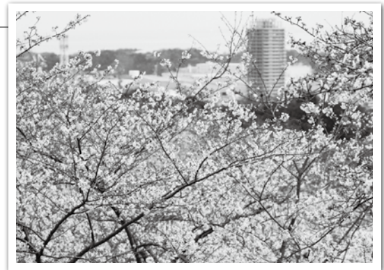
塚山公園からの景色