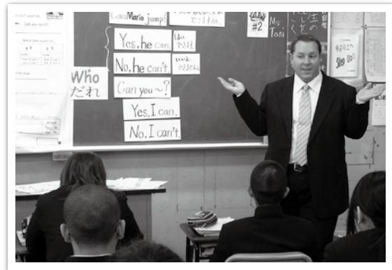
ネイティブスピーカーによる英語の授業