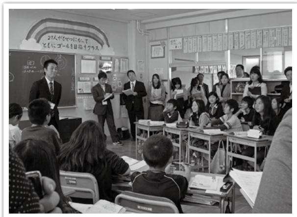
道徳教育の研究授業