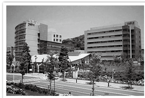
横須賀リサーチパーク（光の丘）