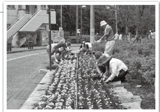
花のボランティアの活動（大津公園）