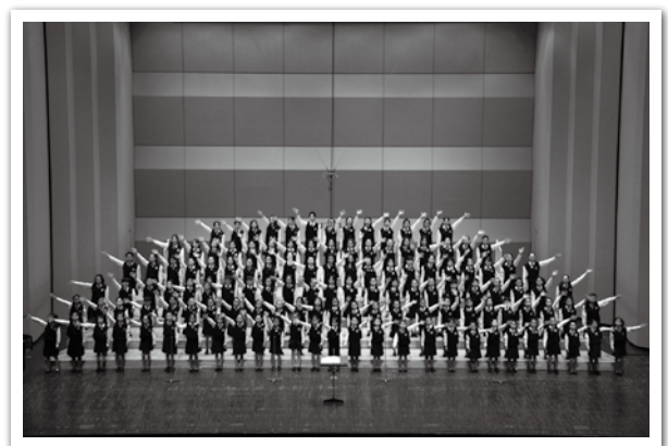
横須賀芸術劇場青少年合唱団