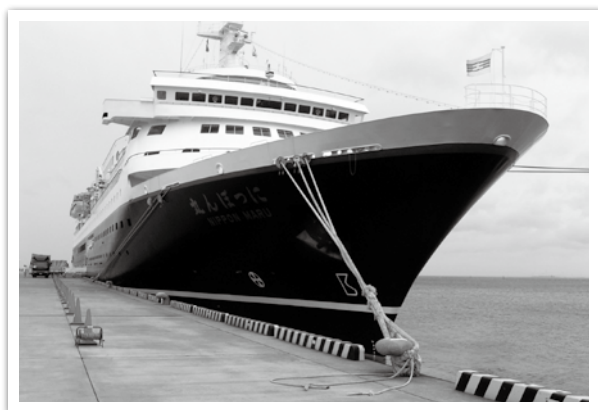
につぼん丸の入港（新港地区）