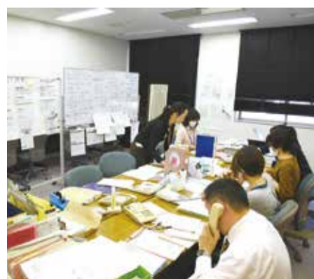
問合せが集中する帰国者・接触者相談センター