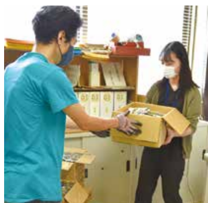
NPO法人神奈川フードバンク・プラス

引き続き、私たちができることに徹底して取り組み、一丸となってこの局面を乗り越えましょう。