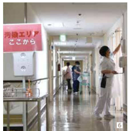
横須賀共済病院 1 2 4 市立市民病院 3 5 6