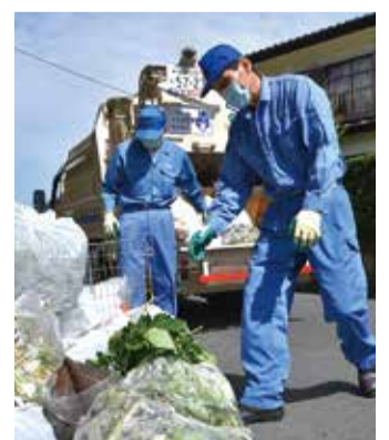
増加するごみを収集する様子