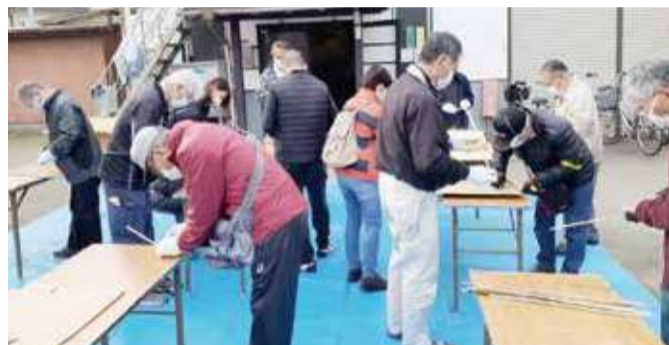
活動の様子(地域イベントの道具づくり)

馬堀小学校区の町内会・自治会、小学校、PTA、体育振興会、子ども会で結成された団体。子どもたちが明るく楽しく安全に、そして地域の人々が安心して暮らすことのできる街にするために結成されました。児童の見守りや通学区域の危険箇所調査など地域に根付いた活動を行っています。