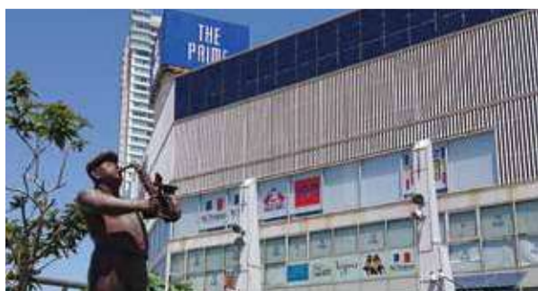
再開発を進めていく横須賀中央エリア

本市の顔となる中心市街地では複数の再開発事業が検討されています。ことし1月には「若松町1丁目地区再開発準備組合」が進める事業を都市計画決定しました。他の地区も含め、市街地の適切な高度利用と防災性の向上、多様な都市機能の整備による魅力やにぎわいの創出に向けて、市では今後も引き続き積極的な支援を行っていきます。