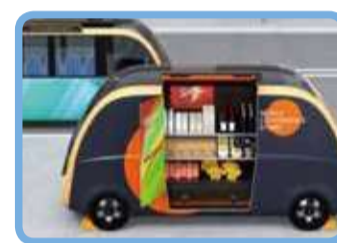
次世代モビリティの通行空間