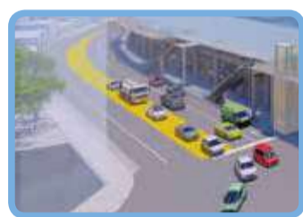
追浜駅前交差点の改良