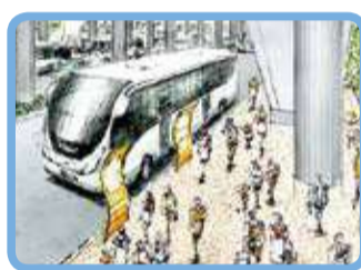
交通ターミナル整備