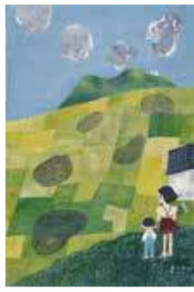
谷内六郎 《雲のかげ》 1959年 ©Michiko Taniuchi

▶第32回全国「みどりの愛護」のつどい開催記念 みどりのちから=7月11日(日)まで