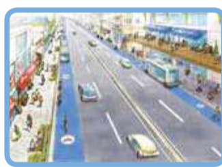
市道追浜夏島線拡幅