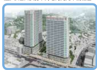
駅前再開発イメージ