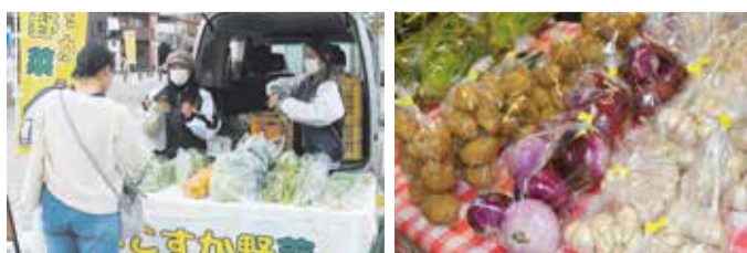
モビリティマルシェでの販売風景

より多くの人によこすか野菜を知ってもらうため、市役所や公園などさまざまな場所で、生産者による野菜の販売を行っています。新型コロナウイルス感染症の影響で出荷先が減った生産者もあり、市ではよこすか野菜を販売する機会をつくり、生産者の応援につなげていきます。