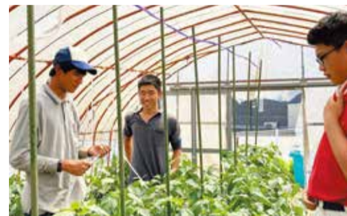
現在は産農人の後輩の指導も行っている

就職後は毎日のように畑に向かい、野菜の成長を見守っている。今はまだ作業を通して知識を吸収している段階だが、早く自分で考え、判断できるようになりたいという思いを抱く。後輩たちには、「目の前のことに一生懸命取り組むことが、きっと将来につながる」と伝えたい。