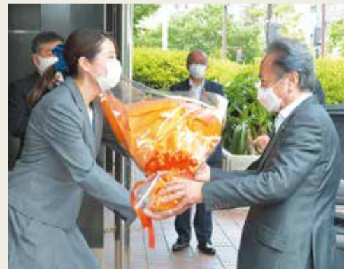
横須賀市長 上地克明