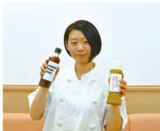
自らが製作に関わる加工品を両手に