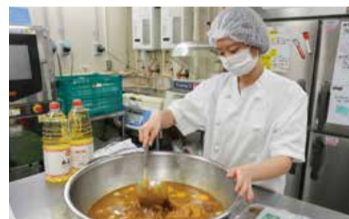
産農人では食品加工の実習が一番楽しかった

産農人の後輩とは、食品加工の実習などで横須賀セントラルキッチンを訪れた際に言葉を交わす。「困ったときはいつでも自分たち先輩を頼ってね」と伝えてある。