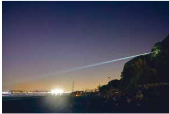
齋藤精一JIKU #004 SARUSHIMA Sense Island2019年の展示風景

通常は立ち入ることのできない夜の猿島を巡る芸術祭です。暗闇の中でいつもとは違う猿島の魅力をアートと共に楽しめます。