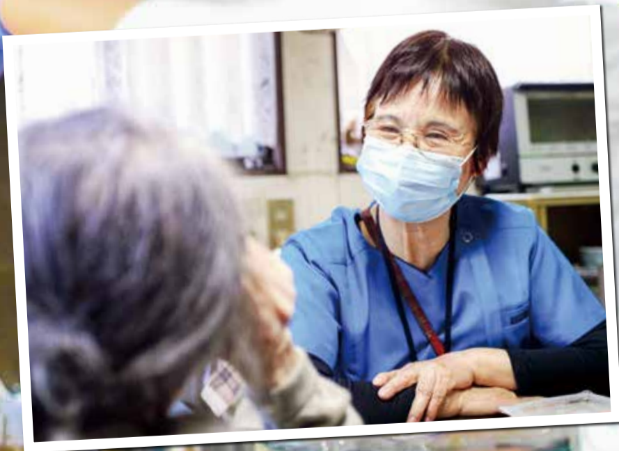
スタッフが高齢者の自宅を訪問し、見守りを行っています。(しろいにじの家)

今まで支援があった(一社)キッチンカー協会や地元飲食店が招かれ、スタッフへ弁当や焼き菓子などを振る舞った感謝祭。苦しい時期を支え合った医療従事者と飲食店事業者が、感謝のエールを交わしていました。(横須賀共済病院)