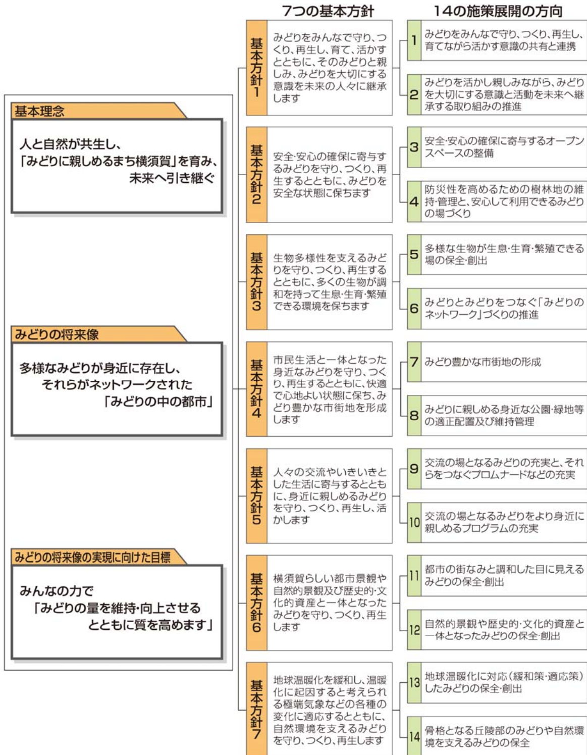
みどりの基本計画における目標と基本方針から施策展開の方向までの体系図

現行計画では、大きな目標「基本理念・みどりの将来像・将来像の実現に向けた目標」と、それらを達成するための「7つの基本方針」に基づく「14の施策展開の方向」を定めました。計画期間の後半も、引き続き、この基本方針等に基づき、目標の実現を図ります。