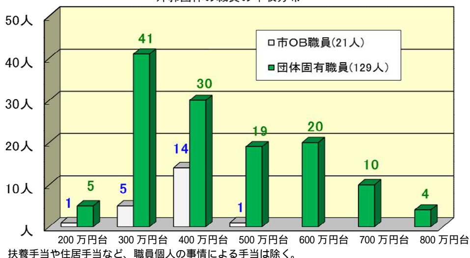
外郭団体の職員の年収分布

常勤役員等（事務局長を含む）は、給与支給者のみ 常勤職員は、臨時職員等（パート、アルバイト、派遣）を除く。