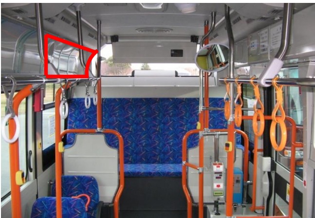
側面の窓上 右側1か所