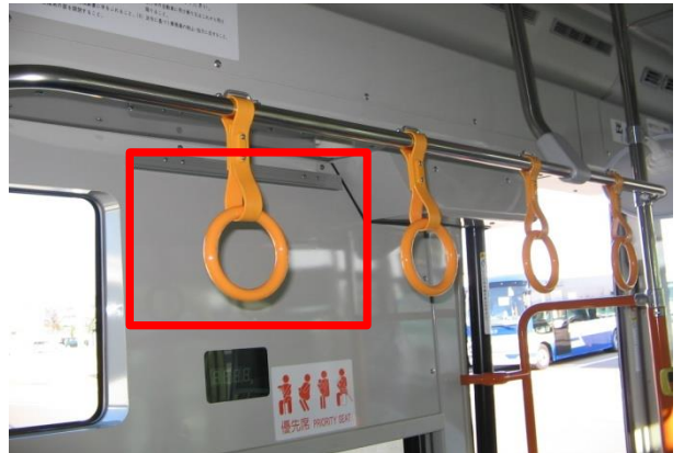
前扉と中扉の間 左側1か所、右側2か所 (広告挟みによるつり下げ式)