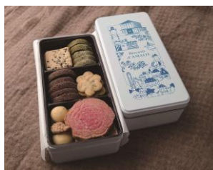
横須賀市観光協会会長賞 「アマルフィイ クッキー缶」 株式会社ビィパリュウ