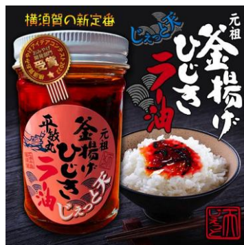
おみやげ開発部門受賞：「よこすか釜揚げひじきラー油」 中華居酒屋じゅっと天