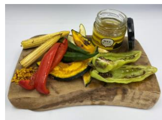
アイデア提案部門受賞 「横須賀ばーにゃ」 宮里恵里さん提案 カプリチョーザ横須賀モアーズ店開発