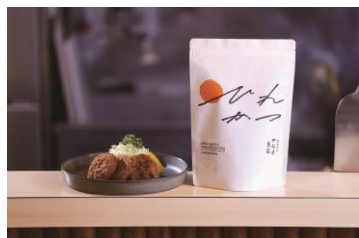
横須賀商工会議所会頭賞 「家で揚げない ひれカツFROZEN PACK」 ひれカツ やなせ支店