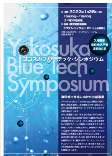
ヨコスカブルーテック・シンポジウムの開催