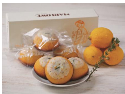
おみやげ開発部門受賞：「横須賀産ハニーレモン潮風ポーロ」 有限会社マーロウ

優秀な提案に対して奨励金の交付を行い開発・販売を支援するとともに、製品化した商品の販売会を実施するなどして、プロモーション活動を行いました。