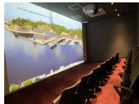
ティボディエ邸 シアター