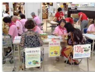
ヘルスマイトよこすか活動の様子

地域でヘルスマイトよこすか（食生活改善増進団体）が活動するための支援や育成・養成を行います。