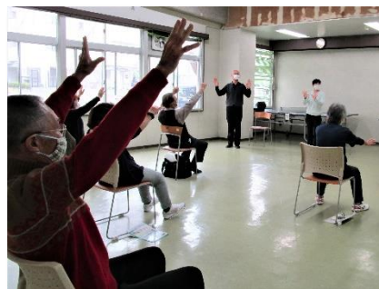
市民公益活動団体による 健康増進事業

行政のパートナーとしての市民活動を支援するため、市民を対象とした公益的な事業でボランティアを募り活動する団体に対する助成を行います。