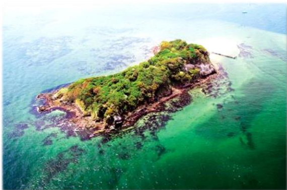
猿島公園内の遊歩道