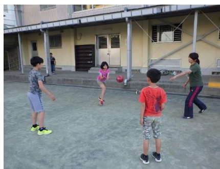
放課後児童クラブの様子

就労等により保護者が昼間家庭にいない小学生を対象とする民設民営の放課後児童クラブへの助成を行います。