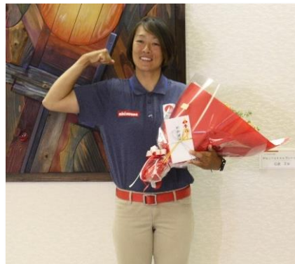
東京 2020 オリンピック日本代表 須長由季選手に活動奨励金を贈呈