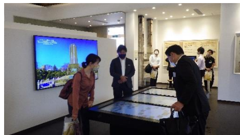
ティボディエ邸 施設内の様子