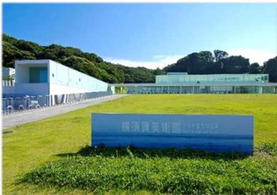
横須賀美術館（屋上広場）

美術品等を購入するための必要な費用に充当します。令和3年度に美術品等を購入する予定です。