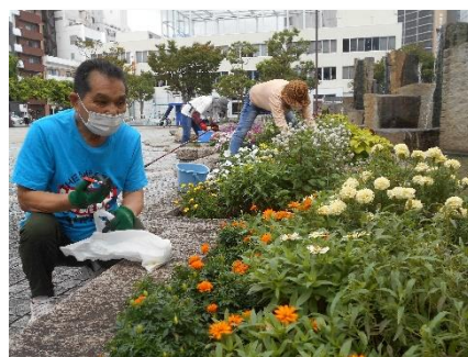
花のボランティア作業

市民が主体となって実施している、公共用地などに花の育成・植え付けを行う取り組みに対して支援をします。