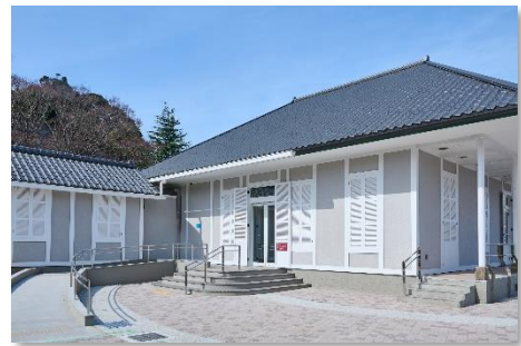
ティボディエ邸 外観