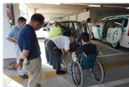
運転ボランティア養成講座

ひとり暮らし高齢者等のご自宅に、緊急通報ボタンを押した時や、12時間以上センサーに反応がない時に事業者のコールセンターに通報する、緊急通報システムの設置を行います。