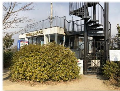
大楠山山頂の休憩所

横須賀を訪れた方々が、快適に横須賀を周遊していただけるよう観光施設の整備や観光地の美化を行います。