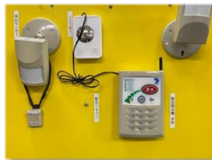
緊急通報システム機器

ひとり暮らし高齢者等のご自宅に、緊急通報ボタンを押した時や、一定時間以上センサーに反応がない時に事業者の受信センターに通報する、緊急通報システムの設置を行います。