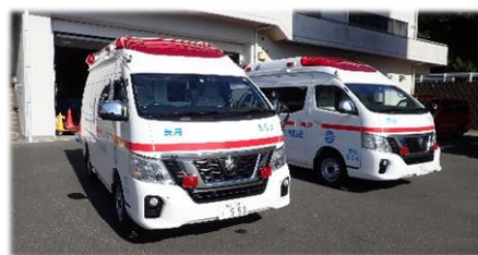
高規格救急自動車