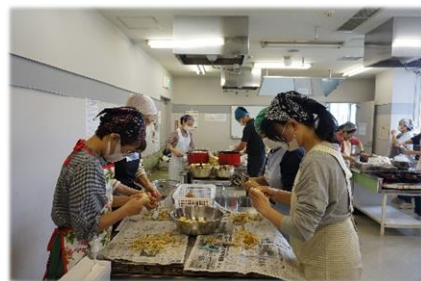
ボランティア活動体験の様子 (子ども食堂調理ボランティア)