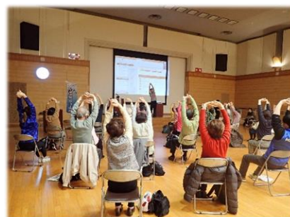
生涯現役フォーラムの様子

食育推進に関する講演会や調理講習会を実施し、市民の皆様の栄養・食生活に関する環境づくりと健康づくりを推進します。