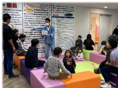
市民公益活動団体による 国際交流事業