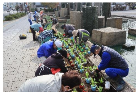
花のボランティア作業

市民が主体となって実施している、公共用地などに花の育成・植え付けを行う取り組みに対して支援をします。