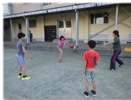
放課後児童クラブの様子

就労等により保護者が昼間家庭にいない小学生を対象とする民設民営の放課後児童クラブへの助成を行います。