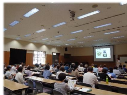
食育推進講演会の様子

地域でヘルスマイトよこすか（食生活改善増進団体）が活動するための支援や育成・養成を行います。