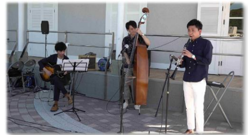
ティボディエ邸前 ジャズライブ

子どもたちへの文化体験の提供と本市とゆかりのある歴史上の人物を紹介する冊子を製作します。