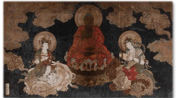
市指定重要文化財 釈迦三尊図 (浄楽寺蔵)

日本遺産などで音楽ライブを行っていくことで、多彩な文化財の魅力を発信するとともに、新たな音楽文化の醸成を図ります。