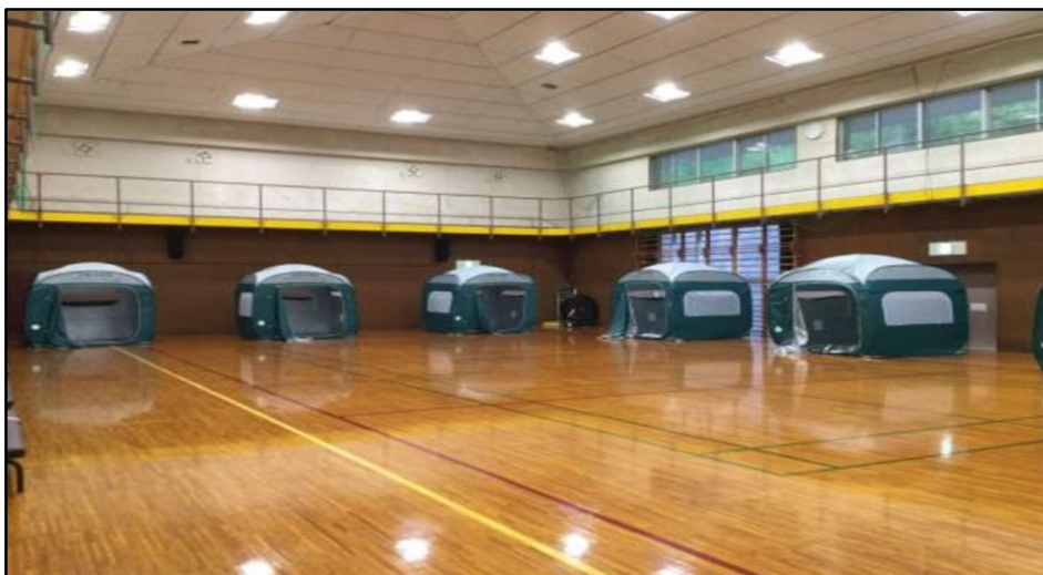
(避難所として開設される鴨居コミュニティセンター：市 HP より)

(5) 前各号に掲げるもののほか、実際生活に即する教育、学術及び文化に関する各種の事業を行い、生活文化の振興、福祉の増進に寄与すること。