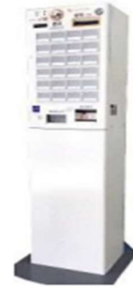
(参考) 専用架台に乗せた場合のイメージ