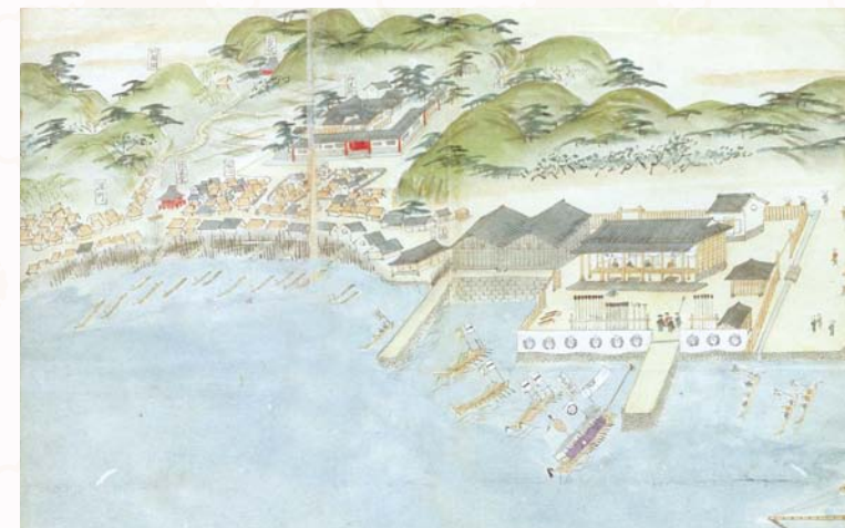
「浦賀湊番船漂着図」国立公文書館所蔵