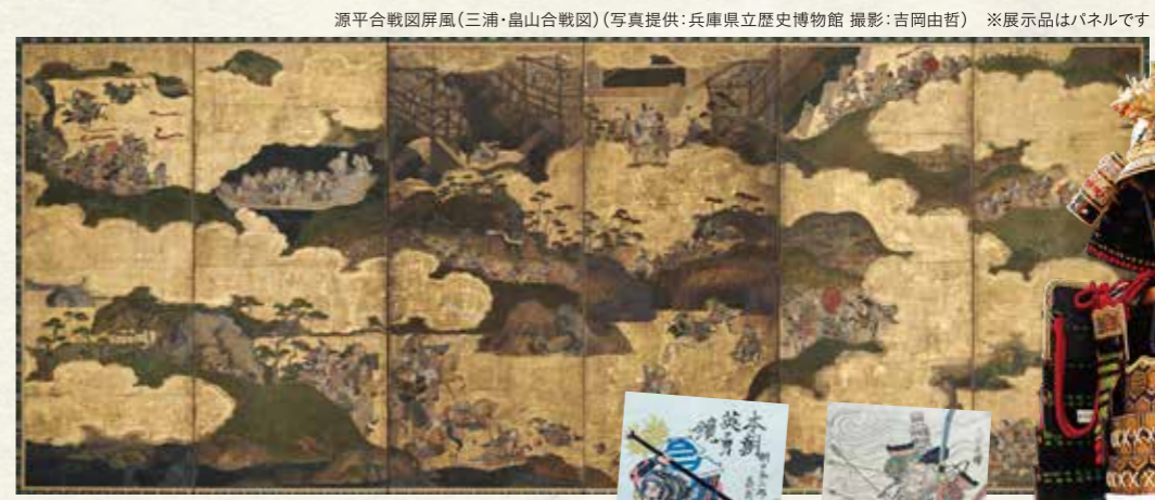
源平合戦図屏風(三浦・畠山合戦図) ※展示品はパネルです