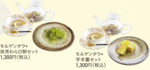
モルゲンタウ+ 抹茶わらび餅セット 1,300円(税込)

観音崎京急ホテル 横須賀市走水2 ☎ 046-841-2200 「観音崎京急ホテル・ 横須賀美術館前」下車 ① 駐車場あり(約140台)