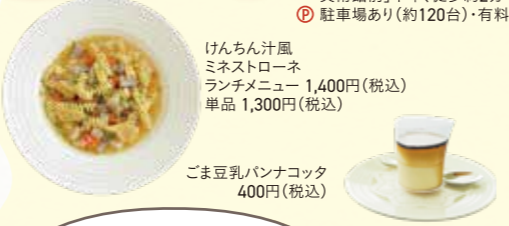
けんちん汁風 ミネストローネ ランチメニュー 1,400円(税込) 単品 1,300円(税込)

横須賀アクアマール 横須賀市鴨居4丁目1 ☎ 046-845-1260 「観音崎京急ホテル・横須賀 美術館前」下車、徒歩約2分 ① 駐車場あり(約120台)・有料