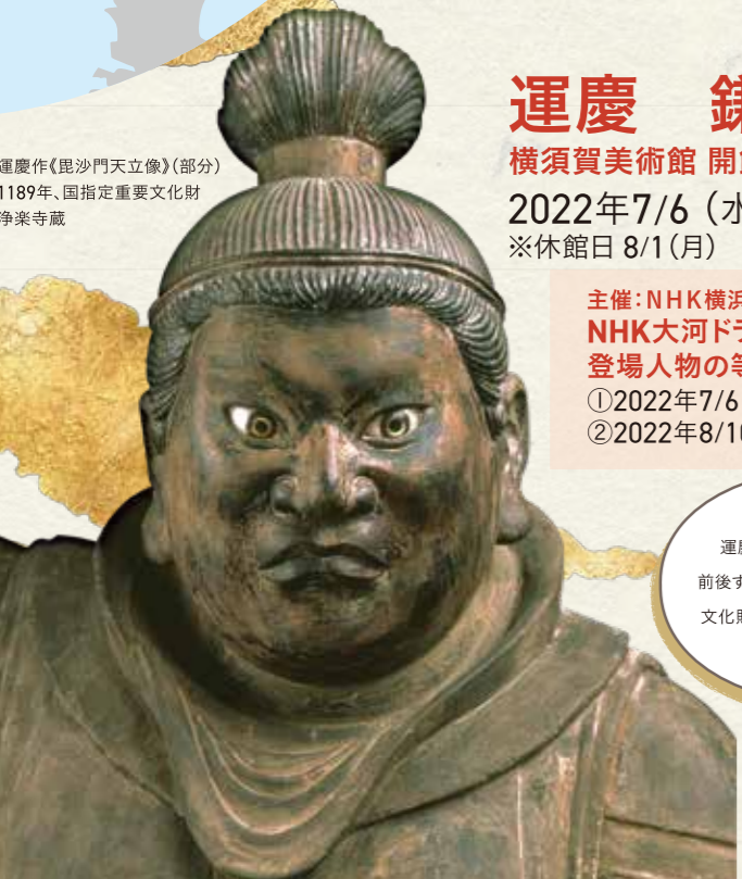
運慶作《毘沙門天立像》(部分) 1189年、国指定重要文化財 浄楽寺蔵