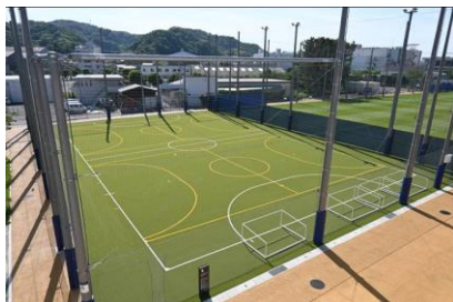
フットサルコート