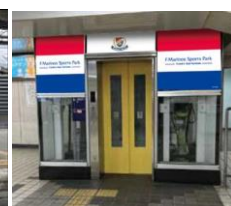
階段 エレベーター 駅構内の装飾 ※イメージ