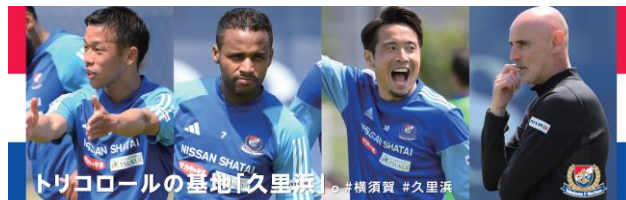
車内の中吊り一例 ※イメージ