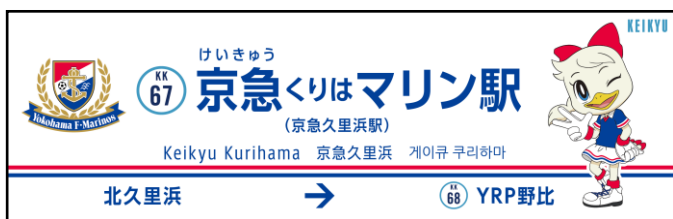
駅名看板の装飾 ※イメージ