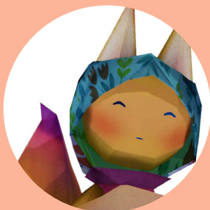
pichikyo (Higashi's avatar)

モバイルバッテリーメーカー「cheero（チーロ）」へ立ち上げから参加し、自社スマホケースブランド「RAKUNI（ラクニ）」を展開する、スマートフォンアクセサリメーカー代表。2021年、VRメタバースの可能性に魅せられ、xRメタバースマーケティングを生業とする (株) 往来を立ち上げた。