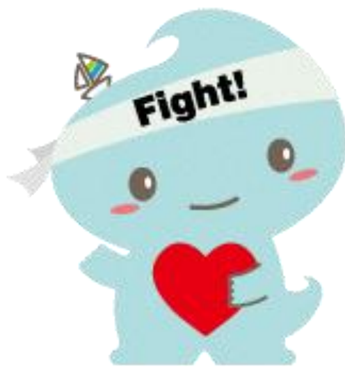
横須賀市イメージキャラクター 「スカリン」