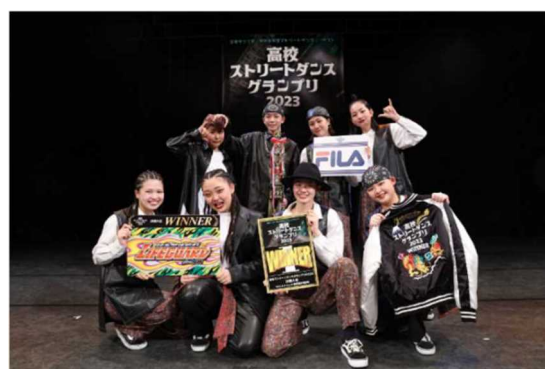
高校生ストリートダンスグランプリ