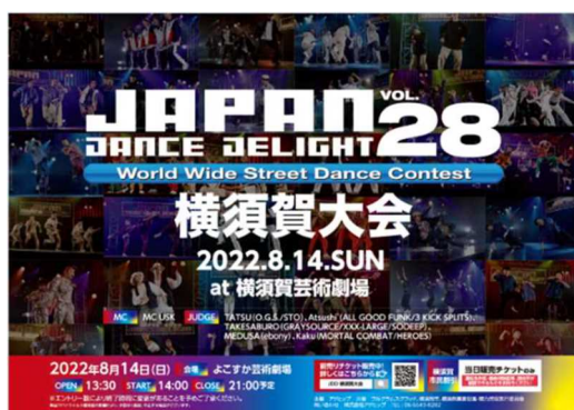
「JAPAN DANCE DELIGHT」令和4年度ポスター

本市出身のEXILE メンバーで、横須賀盛り上げ大使である橘ケンチ氏とEXILE TETSUYA 氏が、横須賀の子ども達を盛り上げたいとの思いから制作し、無償提供してくれた横須賀のオリジナルダンスを自衛隊国際観艦式2022ヨコスカパレード等の大規模イベントで披露しています。