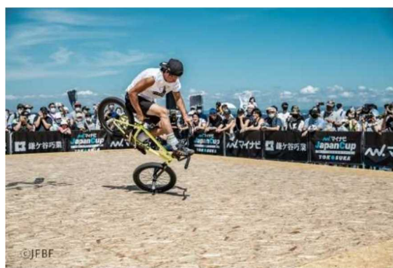
令和4年度マイナビ JapanCup Yokosuka