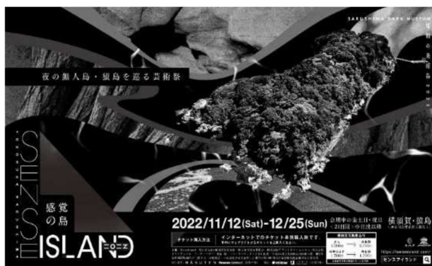
令和4年度ポスター

(JIKU#004_v2022 SARUSHIMA/ 齋藤 精一 (Panoramatik)/2021年度作品)