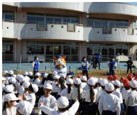
市内幼稚園への野球ふれあい訪問

昨年度実施した取り組みを継続するとともに、追浜・久里浜両地域においてホームタウンチームのデザインを取り入れた街なかの装飾を実施するなど、「スポーツのチカラ」で地域を盛り上げていきます。