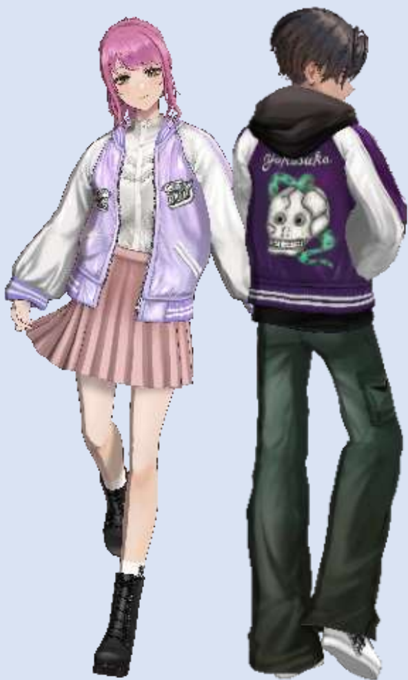
VRoidアバター メンズ/レディース2種類 柄11種類×カラー10種類