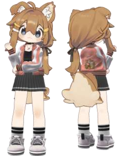
まめひなた ©もち山金魚