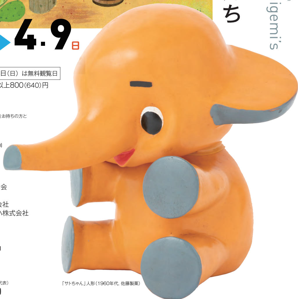
「サトちゃん」人形(1960年代、佐藤製菓)