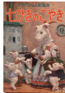
①「ねずみとおうさま」装幀原画（部分）（1953年 岩波のこどもの本 岩波書店）②NHK放送「ヤンボウニンボウトンボウ」2原画（1955年 宝文館）③「大いなる幻影」ポスター 1949年 ④-1、2「七ひきのこやし」下絵、表紙（1957年 凸版印刷） いづれもNPO法人 古き良き文化を継承する会 所蔵