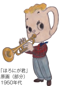
「ほろにが君」 原画（部分） 1950年代