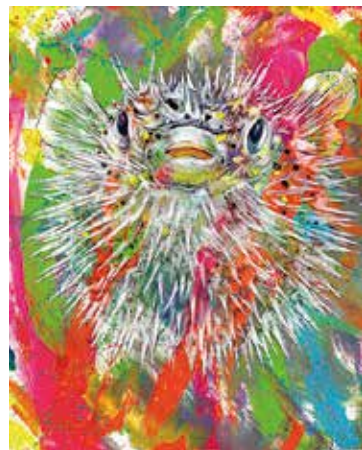
《おこりん坊 ハリセンボン 激おこぶぶん丸》2021年 いずれも作家蔵