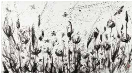
《Mother Earth - Flower - 2018》2018年