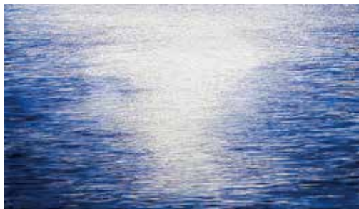
《sunrise ocean - shining blue》2013-14年

企画展「運慶 鎌倉幕府と三浦一族」(7月6日～9月4日)の関連事業「横須賀美術館 能 七騎落」のために描き下ろした舞台背景作品《波と光》もご覧になれます。