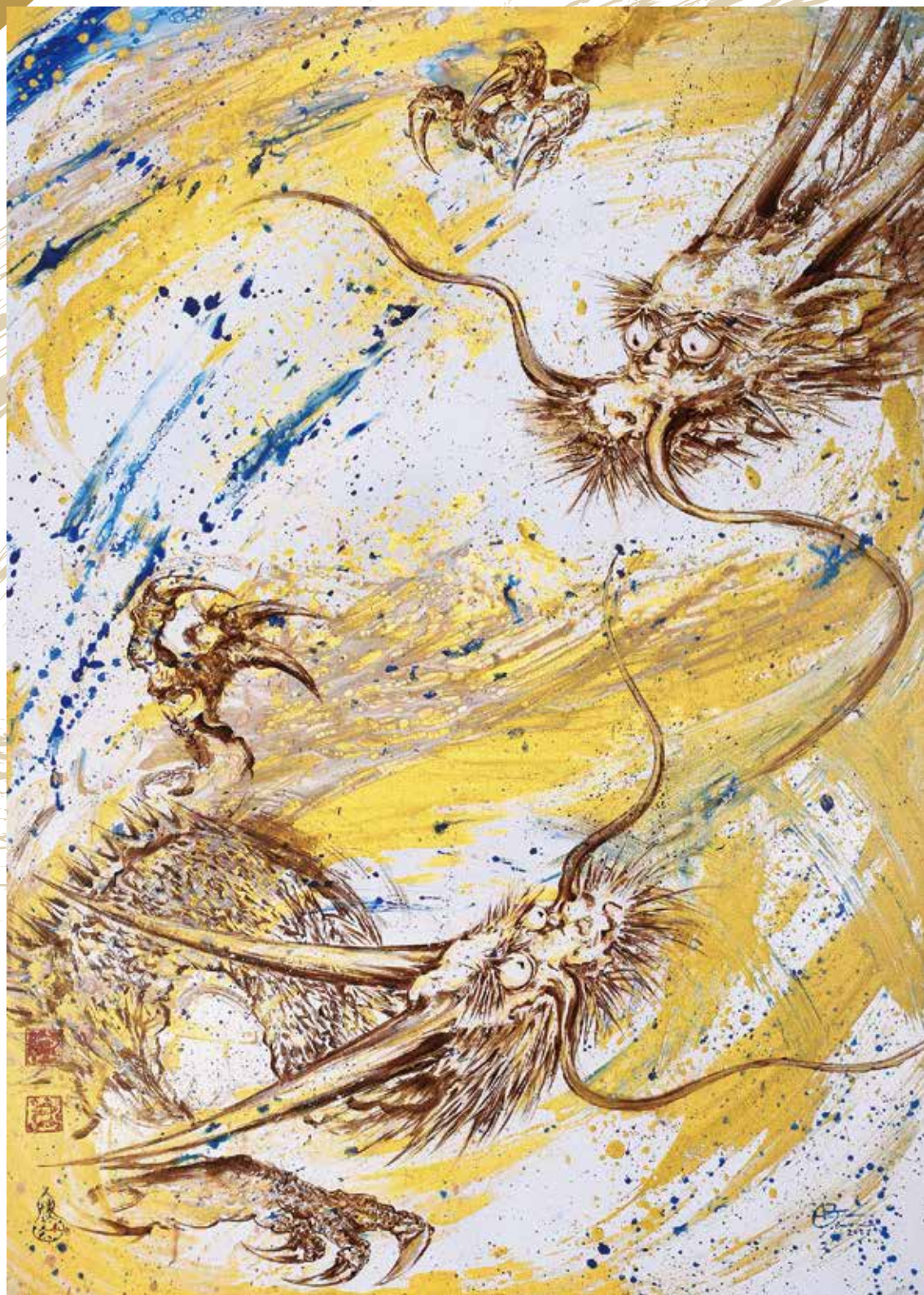
《開国黄金大龍神圖》2021年 作家蔵