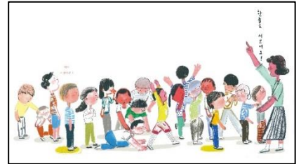
上：スージー・リー『せん』（韓国語版、2017年発行）のためのドローイング。 下：イ・ミョンエ『ぼくって、すてき？』（韓国語版、2022年発行）、p.10-11。