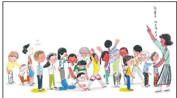
左：スージー・リー『かげ』（韓国語版、2010年発行）p.14-15