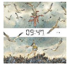
左：ソヒョン [くすぐったい(간질간질)]（韓国語版、2017年発行）表紙。 右：イ・ギフン [09:47] 韓国語版、2021年発行）表紙。