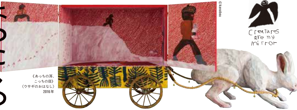
《あっちの耳、こっちの目》 （ウサギのおはなし） 2016年