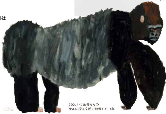
《父という余分なもの サルに探る文明の起源》2015年