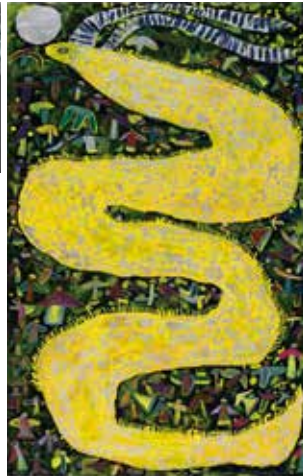
上/《月の光》2021年 下/《万引き家族》2018年