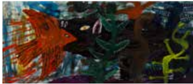
上/《けもののおいがしてきたぞ》2016年 すべて©mirocomachiko