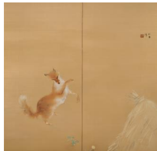
竹内栖鳳《狐》(右隻)1928年、紙本着色、横須賀美術館蔵