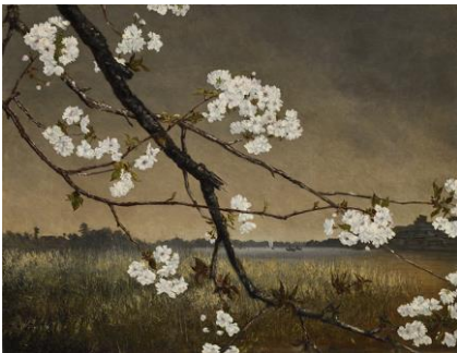
高橋由一《墨水桜花輝耀の景》1874年、油彩・カンヴァス、府中市美術館蔵

明治から昭和初期にかけて描かれた迫真的で緻密な洋画、日本画をご紹介します。洋画では高橋由一、岸田劉生、河野通勢らを、日本画では竹内栖鳳、小茂田青樹らを展示いたします。