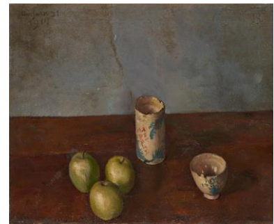
岸田劉生《静物（湯呑と茶碗と林檎三つ）》1917年、油彩・カンヴァス、大阪中之島美術館蔵