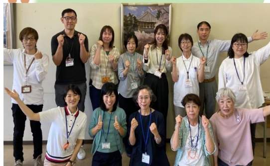
生活支援コーディネーター