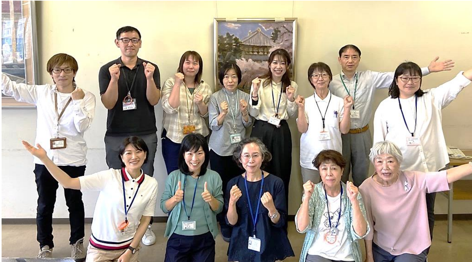
横須賀市内配置の生活支援コーディネーター