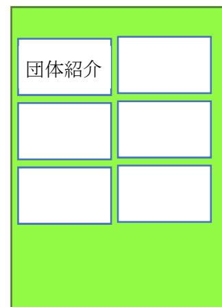
(例) 模造紙サイズ1枚に6団体