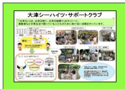
(例) 模造紙サイズ1枚に1団体