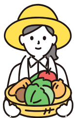
給与天引きではない方 年金天引きの方など

(5月中旬頃から就労先宛てにお送りしています。お手元がない方は就労先にお問い合わせください。)