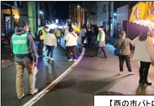
【西の市パトロール(12/2)】